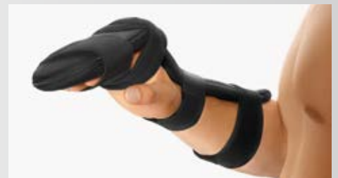
Bild verdeutlicht die Anlage der Klettbänder. Der Daumen bleibt frei.

Bei Verwendung von Zwischenfingerstreifen können Hautmazerationen vermieden werden. Alle oder einzelne Langfinger können fixiert oder in der Schiene frühfunktionell beübt werden. Es können auch Zwillingzügel verwendet werden.